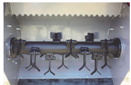
Sistema de cuchillas posicionadas en pares en forma de Y.