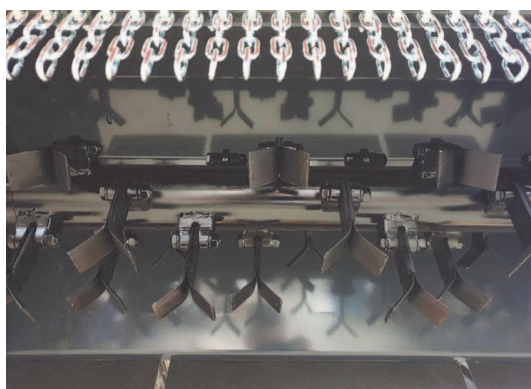
Sistema de cuchillas posicionadas en pares en forma de Y.

Hierba, ramas, vegetación baja, matorrales y rastrojos: esta máquina no se detiene ante nada, asegurando una limpieza a fondo de terrenos, huertos y viñedos gracias a la unidad de corte eficiente y potente y la amplia anchura de trabajo de 85, 95 o 110cm, según el modelo elegido.